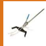
VELEUSE HK 2020 Tête PVC