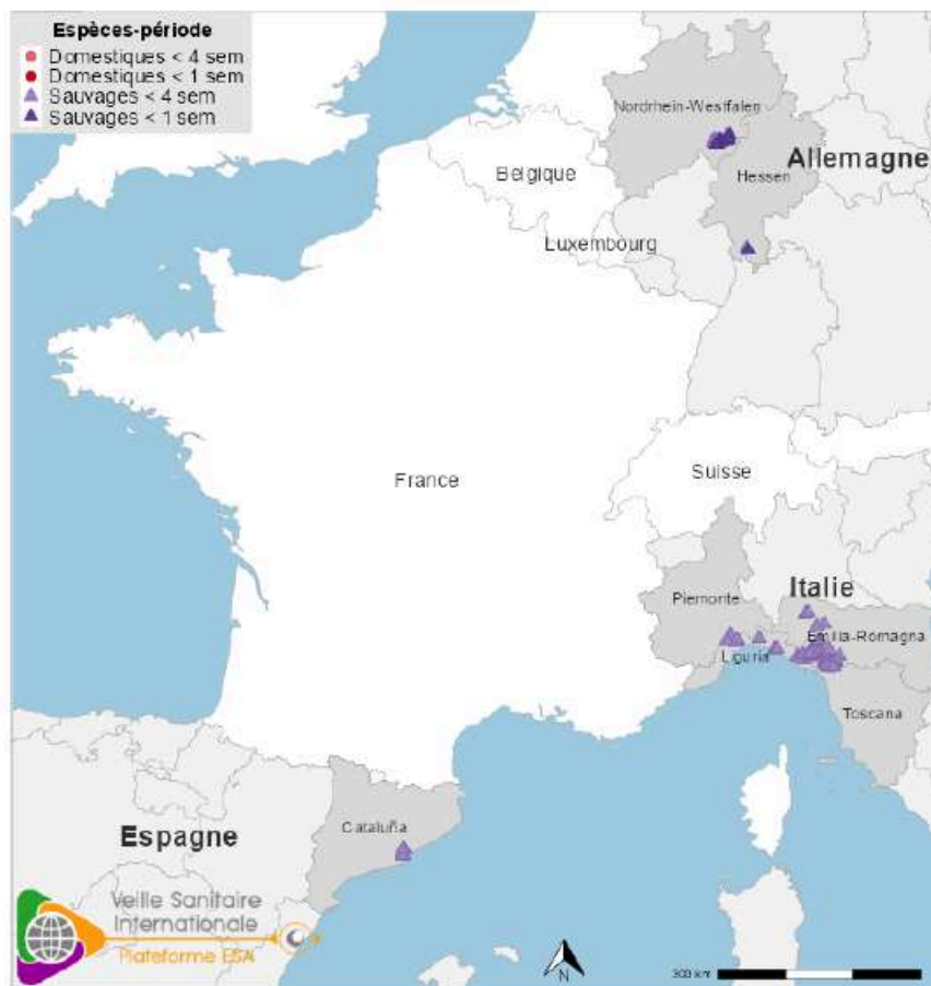
Figure 2. Localisation des cas et foyers de PPA détectés en Allemagne, Espagne et Italie au cours des quatre dernières semaines. NB : Plusieurs cas peuvent être superposés..